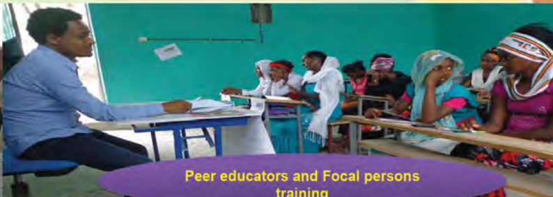
Peer educators and Focal persons training

ካለፈው በመቀጠልም እነሆ የሦስተኛውን ሩብ ዓመት የፕሮጀክት ትግብራ ዜና የያዘና ከጽንሰ ማስወረድ ጋር ተያያዥነት ባላቸው ጉዳዮች ላይ ጥንታዊ የፍልስፍና ሰዎች ስለ ውርጃ ያራምዱአቸው የነበሩትን ጽንሰ ሃሳቦች እንዲሁም በዘመኑም ያሉ የተለያዩ ሀገራት መንግስታትና የኢትዮጵያ መንግስት ጽንሰ ማስወረድን አስመልክቶ ያስቀመጧቸውን ድንጋጌዎች የሚያብራራ መጽሔት ይዘን ቀርብናል።