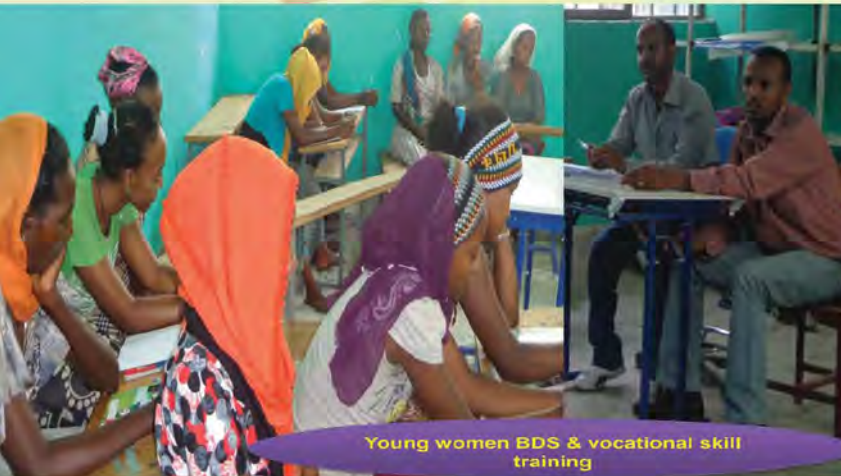
Young women BDS & vocational skill training

Dynamically, laws of countries pertaining to abortion have been changing and improved from time to time. As a result, now, most of the countries liberalized their laws. Similarly, Ethiopia has also liberalized and revised its penal code of 1957 sections (528 -535) which was permitting abortion very limitedly. According to the revised Criminal Code of the Federal Republic of Ethiopia, not withstanding to the legal prohibition of abortion in the 1957 penal-code, abortion allowed by law in the following conditions: