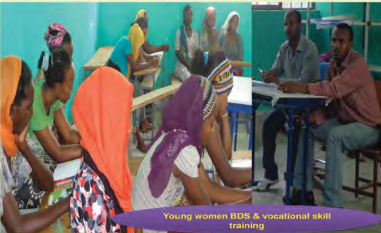
Young women BDS & vocational skill training